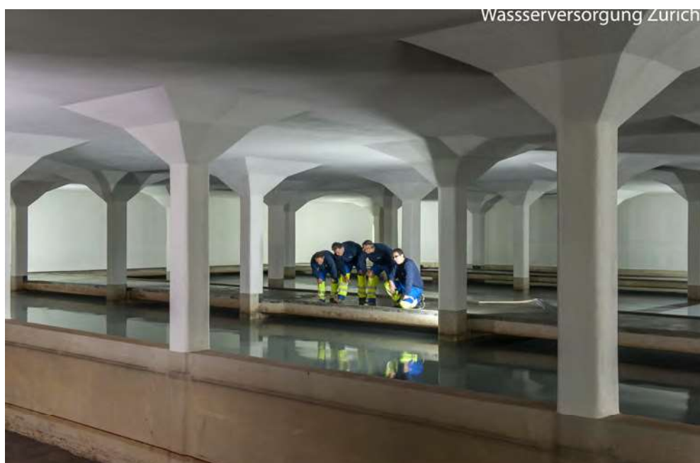
Zisterne der Wasserversorgung Zürich